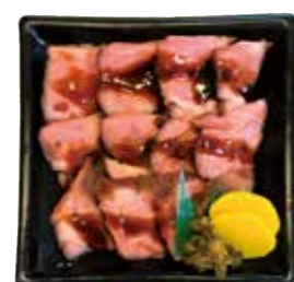
ローストポーク丼 620円