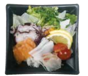
海鮮4種のサラダ 500円

マツタケ、椎茸、しめじなど秋の味覚がいっぱい “秋の味覚”天ぷら盛り合わせ 500円