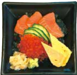
サーモンといくら丼 750円