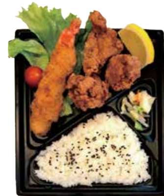
エビフライ唐揚げ弁当 680円