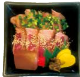
黒毛和牛ステーキ丼 1200円