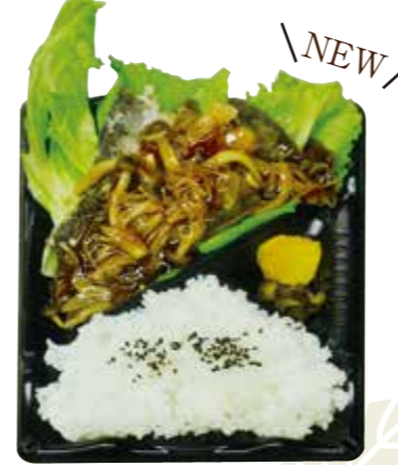
秋刀魚の唐揚げ 秋野菜あんかけ弁当 680円