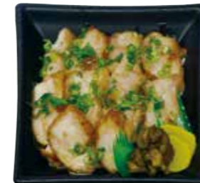
地鶏香味焼き丼 620円