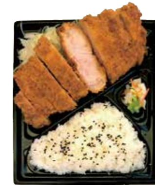
国産ロースカツ弁当 800円