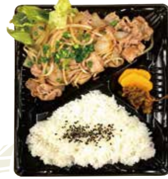
スタミナ豚弁当 680円