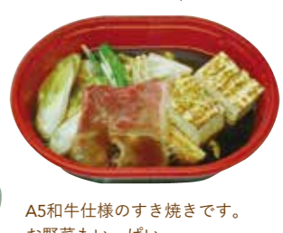
A5和牛仕様のすき焼きです。 お野菜もいっぱい。 すき焼き単品 980円