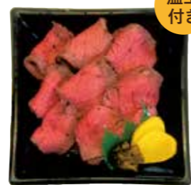
ローストビーフ丼 750円