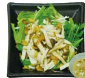
しめじ、椎茸、エノキの 3種のきのこのサラダです。 きのこのサラダ 450円