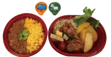
デザート付き お子様弁当 500円